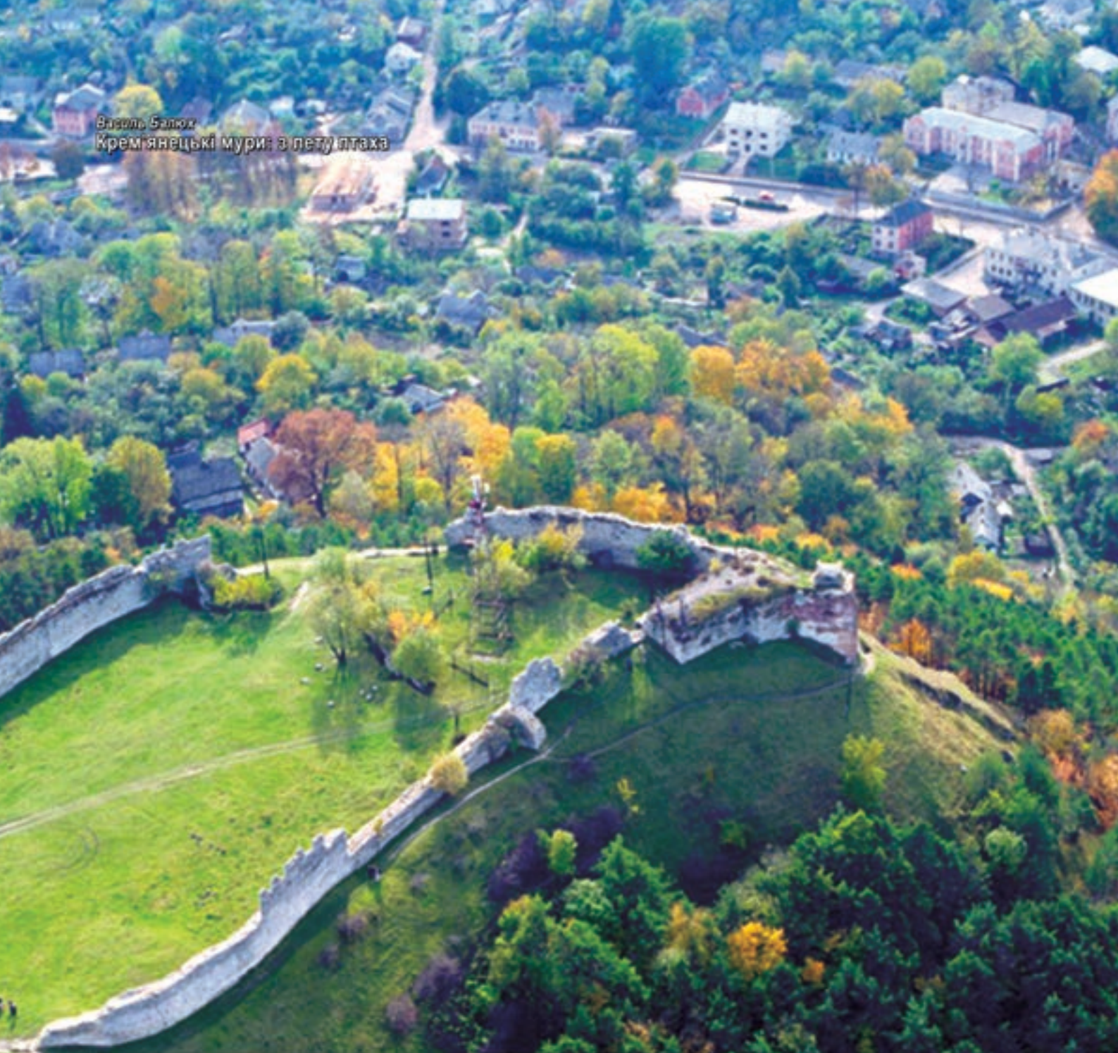
Василь Балух Крем'янецькі мури: з пету птаха