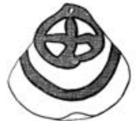
Кошилівецька кераміка із символічними знаками