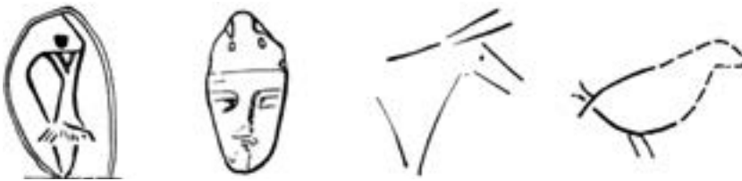
Кошилівецькі зображення людей і тварин