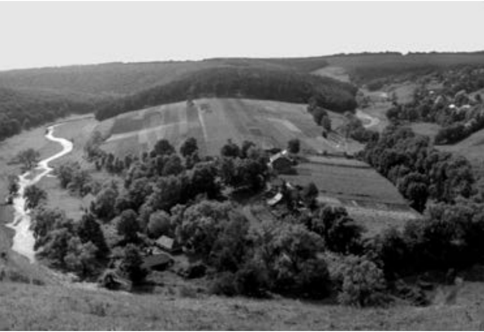
Василь Балюх Загальний вигляд на урочище Обоз. 1998