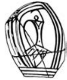
Зображення людини на кошилівецькому посуді

У 1949 році Тетяна С. Пассек запропонувала власну періодизацію трипільських поселень, підсумувавши напрацювання учених за попередні роки щодо послідовності розташування пам'яток. Зважаючи на виділені відмінності груп й фаз в періодах А та В, складених Олегом Кандибою, дослідниця розширила їхню змістовність за допомогою численних нових відкриттів та розкопок. Вона поєднала всі трипільські пам'ятки у єдиний процес розвитку культури, взявши за основу повний відомий ареал розповсюдження поселень Трипілья: Подністров'я, Південне Побужжя та Подніпров'я. З урахуванням уже відомих численних пам'яток, Тетяна Пассек розширила періоди Олега Кандиби, запропонувавши послідовність за трьома періодами розвитку: ранній — середній — пізній. До того ж, пізній період розділявся на північний та південний краї поширення культури (Пассек Т.С. Периодизация трипольских поселений // Материалы и исследования по археологии СССР. — Москва — Ленинград. — 1949. — №10).