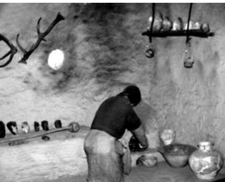
Експозиція Тернопільського обласного краєзнавчого музею. Глиняний посуд, виліплений вручну з відмуленої глини