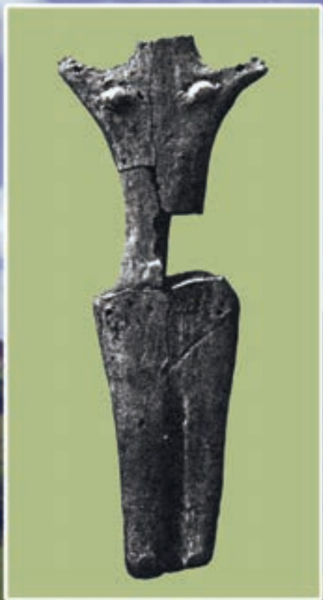
Кошиловецька «Оранта», Світлина З альбому Кароля Гаданека. Т. XXVI. 237