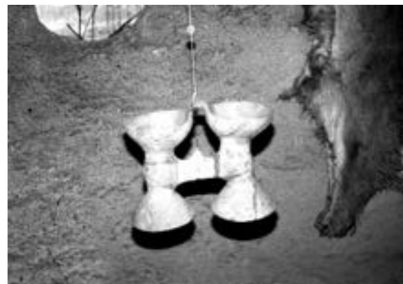
Культурний біноклеподібний глиняний прибор

Кошилівці своїми підземними старожитними багатствами зацікавили і дослідника Леона Козловського, який відважився на Обозі провести