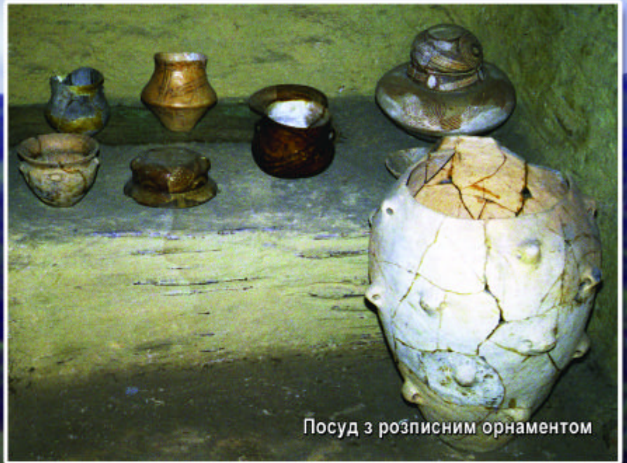
Посуд з розписним орнаментом