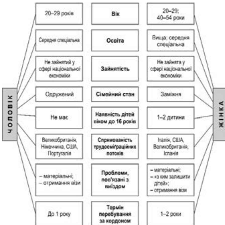
Рисунок 1. Портрет українського трудової мігранта

Вибуховий характер трудої міграційних процесів в Україні вимагає проведення активної еміграційної політики, яка повинна захищати не лише інтереси особи, а й забезпечити рівноважне, пропор-