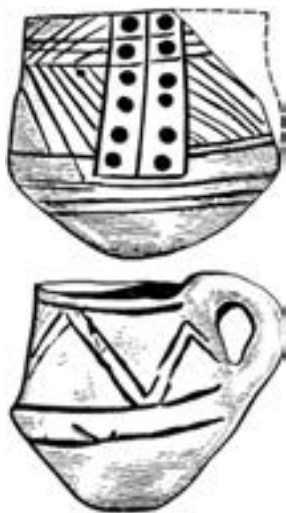
Геометричний розпис кошилівецької кераміки

— Кошилівці, урочище Обоз, Заліщицький район Тернопілля, головне заголовкове;