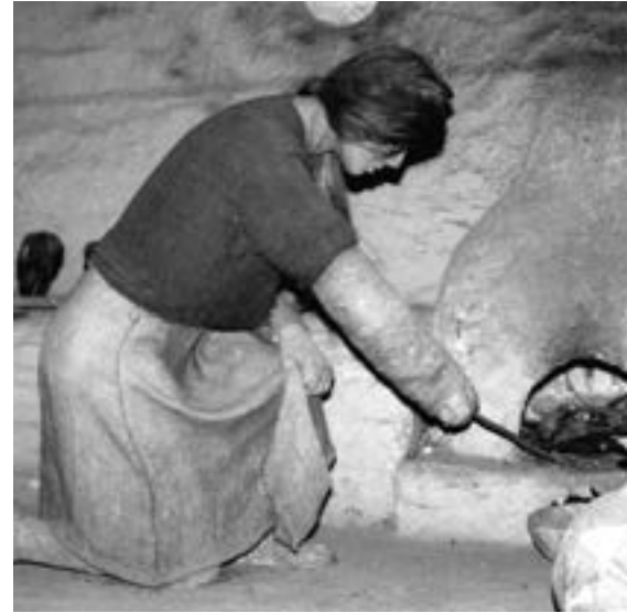
Експозиція Тернопільського обласного краєзнавчого музею. Глиняна Піч

Пояснювані не схемою, а дитячим еством, — це я розумів ще задовго до прочитання Марра. Які мені потрібні аргументи, коли я чую ось цю коляду: «Ой до цього дому, ой до веселого, Святая. Ой у цім домі золотий столик, Святая. На тім столику лежить ставка, Святая. На тій отавці золота скатерка, Святая. На тій скатерці Тайна вечеря, Святая». Глибоко переконаний, що Тайна вечеря прийшла в цей розспів разом із християнством, бо логічно було чути «Свята вечеря»... і українці задовго до прийняття віри Христової