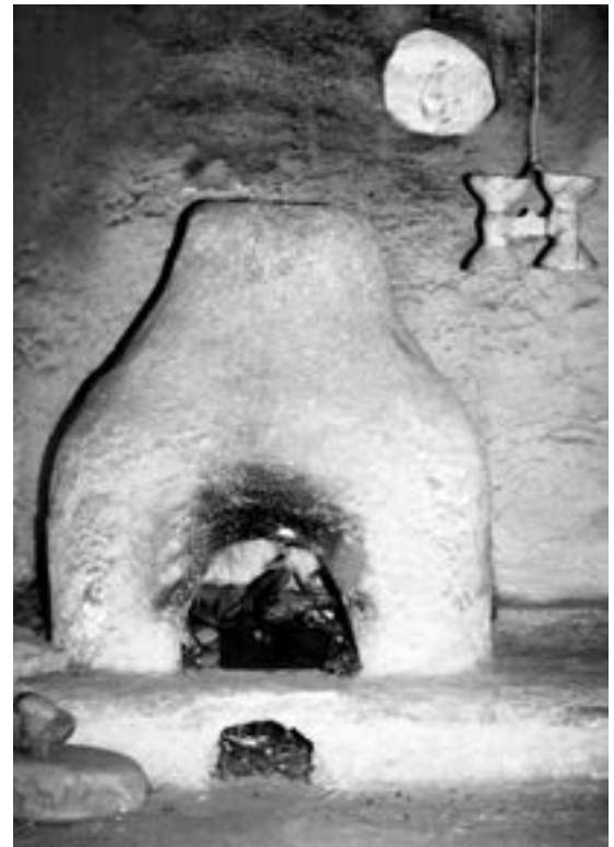
Експозиція Тернопільського обласного краєзнавчого музею. Глиняна Піч

Можливо продовжували існувати і невеликі наземні житла, конструкцію яких поки що не виявлено. Залишки наземних жител знайдено на поселенні поблизу села Лози, у верхів'ї Горині. Від них збереглося кілька невеликих міцно випалених глиняних площадок, розміри яких не перевищували 2 x 1 м.