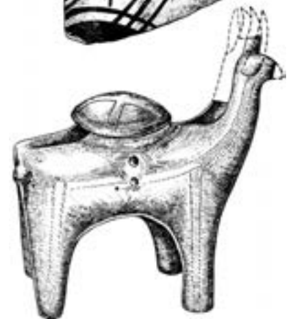
Мальоване і скульптурне зображення бика у пізньому Трипільлі. Кошилівець-Обоз