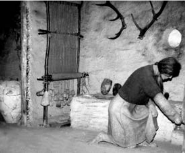
Експозиція Тернопільського обласного краєзнавчого музею. Трипільське дво-камерне (2-кімнатне) житло

Пізньотрипільські жителі виготовляли і антропо- та зооморфні фігурки. Часто зображались домашні тварини (коротконогі й довгорогі воли, менше кінь і собака). Жіночі постаті передаються ще більш схематизовано. При тому за собаками розписних ліній на деяких статуетках — Кошилівці — відтворено риси одягу, взуття, а також прикраси, зачіску тощо.