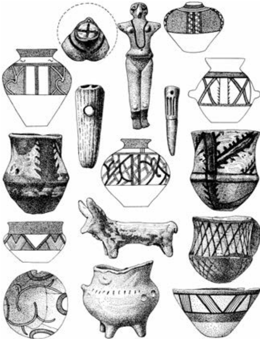
Кошівці-Обоз. Глиняні вироби і вироби з кістки

Уперше, як зазначалося, пізньотрипільські поселення у Верхньо-