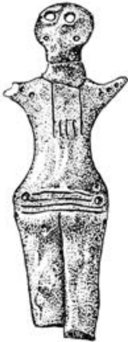
Кошилівецька глиняна підвіска

З'ясування додаткових рис дає підстави говорити, що статуетка в цілому окреслює людину не просто