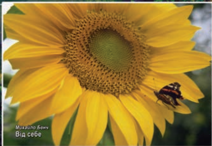
Михайло Бенч Від себе