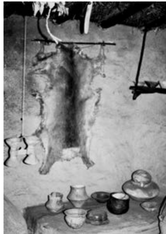
Експозиція Тернопільського обласного краєзнавчого музею