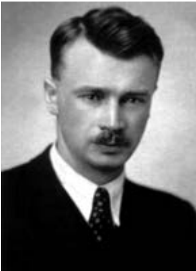
Олег Кандиба (Олег Ольжич)