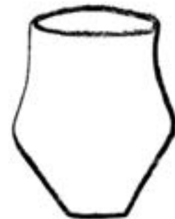
Форми посуду культури Трипільля-Кукутені. Кошиловецька чаша (келик)