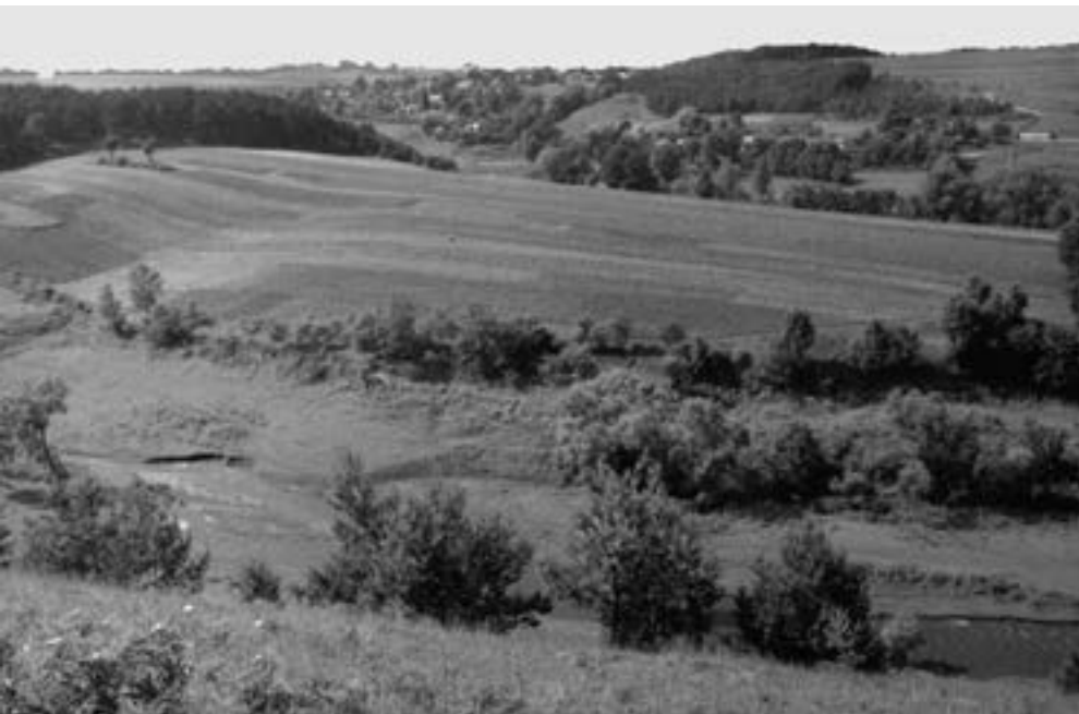
Василь Балюх Вигляд збоку на урочище Обоз. 1998

фахову освіту та підготовку, д-р Олег Кандиба зумів збагнути сутність і наблизитись до першооснов розвитку цієї культури. Це допомогло йому визначити — знову вперше в тодішній старожитній науці (археології) — відміни мальованої кераміки, що й відповідало послідовності її розвитку на Верхньому Подністров'ї.