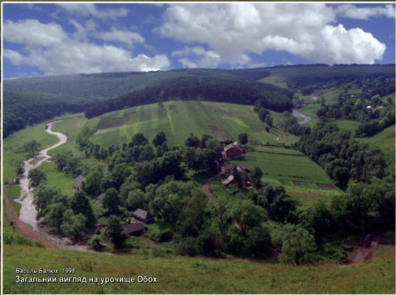
Василь Балюх. 1998 Загальний вигляд на урочище Обох