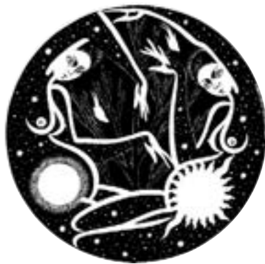
Микола Морозовський. «З української космогонії».

На першій сторінці обкладинки: фрагмент триптиху Ніни Марченко «Голод 1932–1933 років в Україні».