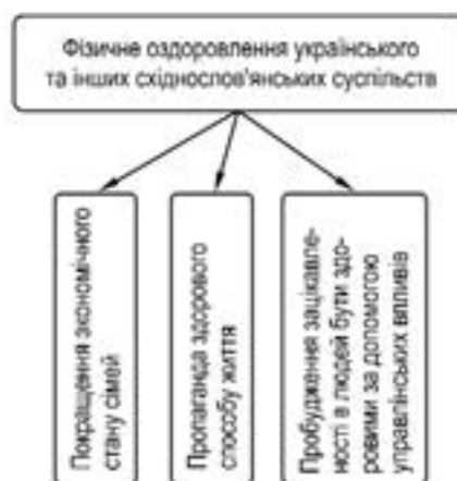
Рис. 1. Тріада чинників підвищення рівня здоров'я українського та інших східнослов'янських суспільств

Ситуацію можна змінити, якщо розкрити ідеологічну суть нової управлінської культури й інноваційний ме-