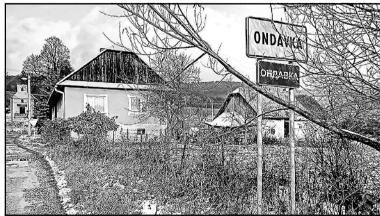
▲ Вид на село.

при джерелі ріки Ондави. Належало Маковицькому панству. Перша письмова згадка про село датується 1618 роком. На той час в Ондавці жили 1 шолтиська і 6 селянських родин. У 1787 р. Ондавка мала 19 будинків, 114 жителів, 1828 – 25 будинків, 190 жителів, які займалися землеробством,