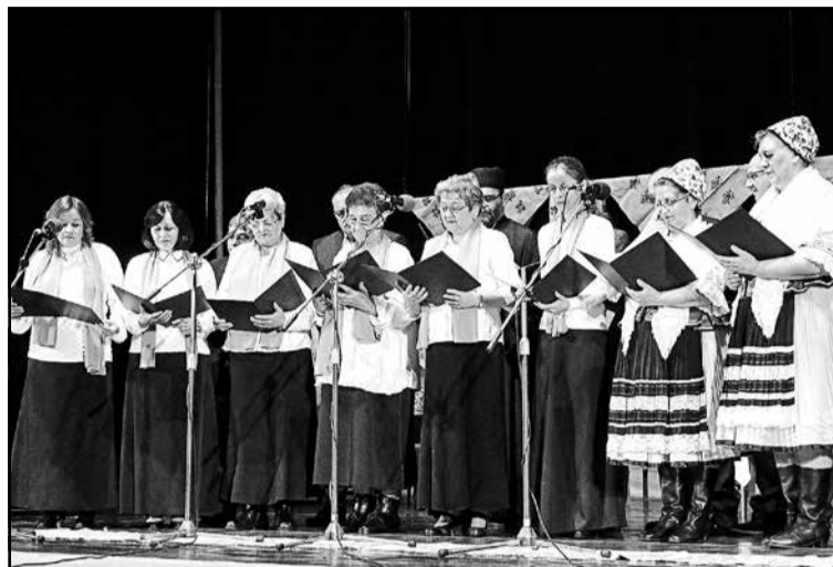
▲ Хор православного приходу в Снині.