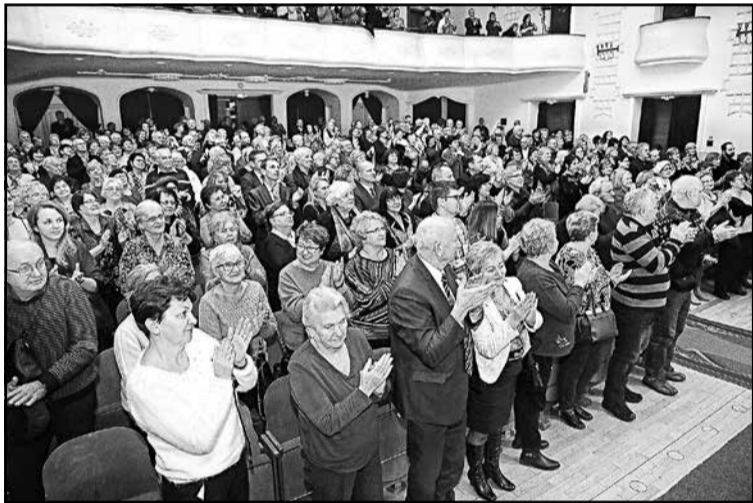
▲ Ансамбль «ПУЛЬС» з Пряшева підняв зі стільців і глядачів Новорічного концерту русинів-українців.

Українську пресу Словацької Республіки – журнали «Дукля», «Веселка» та газету «Нове життя» – можна читати за такою адресою: 4hvyliia.com/zmi