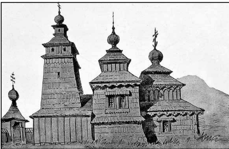
▲ Так до пожежі виглядала дерев'яна церква в Ондавці.