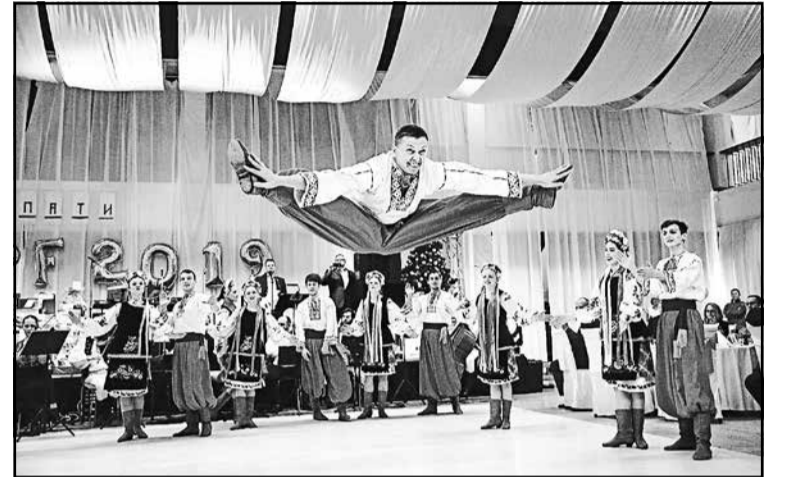
▲ «Гопак» Піддулянського художнього народного ансамблю «ПУЛЬС» з Пряшева підняв учасників балу зі стільців.

І в програмі Новорічного концерту виступив Піддулянський художній народний