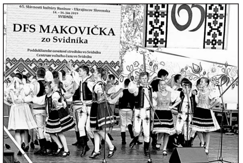
▲ Колектив «Маковичка» з Свидника.

Ми щиро вітаємо це важливе досягнення і поздоровляємо. Ладіслав БАЧИНСЬКИЙ.