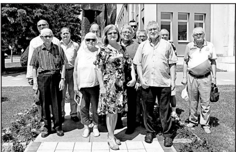
▲ Письменники покладали квіти до пам'ятника Олександрові Павловичу в Свиднику.

ступів колективів народної художньої творчості Пряшівського краю, головним чином з Свидниччини, Бардівщи-