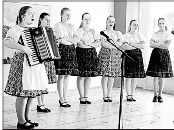
▲ У снинській «Кацерці» виростає якісний співацький колектив.