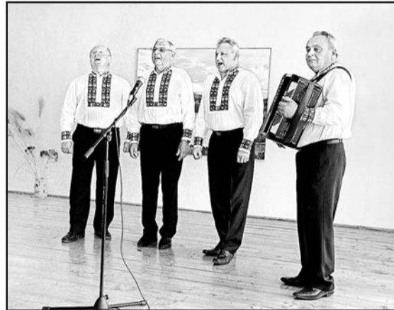
▲ Фольклорна група «Кичара».