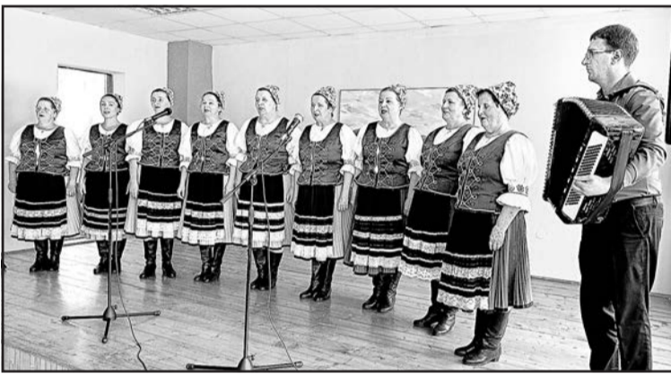
▲ Високий пісенний стандарт несе глядачам фольклорна група «Старинчанка».

дальших сіл колишнього Гуменського округу.