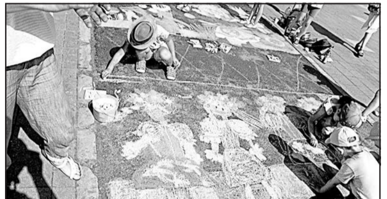
▲ Тематика Свята культури русинів-українців Словаччини у Свиднику домінувала в «Малюванні на асфальті» дітей дитсадків і основних шкіл міста Свидника.

Через спеку організатори перенесли дитячу програму «Черепки» в амфітеатрі на підвечірній час. В програмі виступали дитячі свидницькі