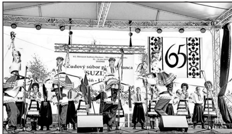
▲ Народний ансамбль пісні і танцю «Сузір'я» з Ірпіня (Україна).