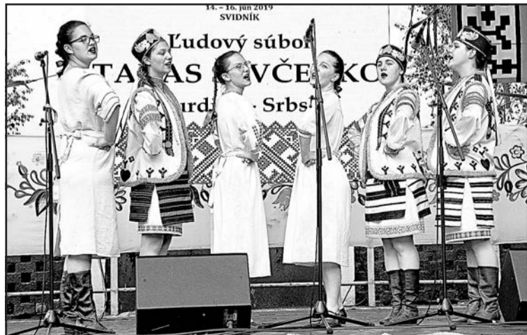
▲ Культурно-художній ансамбль ім. Тараса Шевченка з Дюрдьова (Сербія).

Мирослав ЛЮК.