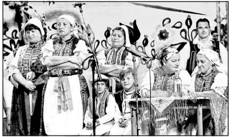
▲ Фрагмент програми фольклорного колективу «Курівчан» з Курова.

У післяобідній час в СНМ – Музеї української культури у Свиднику відбувся вернісаж виставки картин українського художника Сергія Степанова. Тут же було відкрито виставку «Розвиток ремесел», на якій показані роботи студентів свидницької Середньої професійної школи, та «Огляд