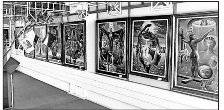
▲ Так виглядала експозиція картин Павла Лопати в Калинові.