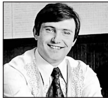
▲ Володимир Івасюк.

Регіональна рада СРУСР в Пряшеві в рамках циклу «Наша дума – наша пісня» 8 листопада 2019 року провела літературно-художній вечір, присвячений 70-річчю з дня народження українського композитора і співака, поета, одного з основоположників української естрадної музики Володимира Івасюка (4.3.1949 – 24/27.4.1979). Володимир Івасюк – автор 107 пісень і 53 інструментальних творів. Хоч він прожив всього тридцять років, проте його пісні постійно звучать по всьому світу, вони дуже популярні, зокрема, такі як «Червона