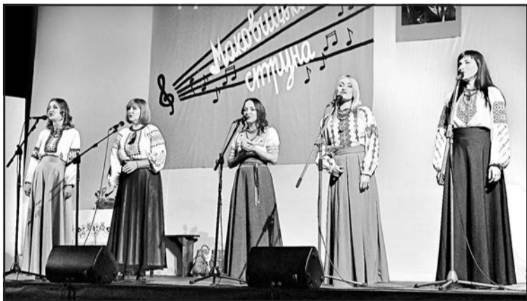
▲ Ансамбль «Намисто» з Калуша.