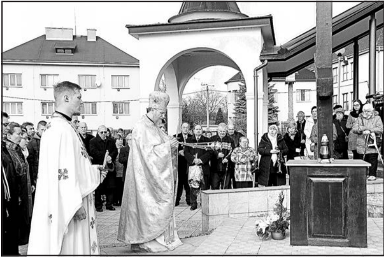
▲ Під час панахиди перед Хрестом-Пам'ятником в Пряшеві 24.11.2019 року.