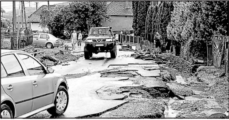
▲ Наслідки проливних дощів у Пихнях. 19.6.2020 р.