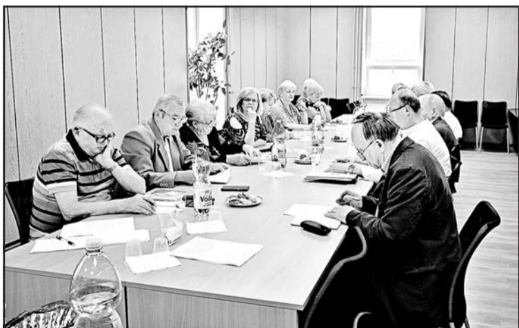
▲ Під час роботи Центральної ради СРУСР.

інформував про діяльність Президії ЦР СРУСР за перше півріччя 2020 року. На трьох регулярних засіданнях і двох аудіо-нарадах Президії були прийняті важливі рішення у діяльності організації в першому півріччі 2020 року.