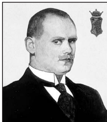
▲ Іван Кулець. Автопортрет, 1910. Полотно, олія.

Крім педагогічної діяльності, Іван Кулець займався також живописом, рисунком, графікою та скульптурою. З образотворчих жанрів найбільшу увагу приділяв імажинарному портрету, фігуральній композиції та натюрморту, а з образотворчих технік найчастіше використовував живопис, мішану техніку, рисунок олівцем або тушшю, гуаш, акварель, різьбу та ліплення. Його творчість складається переважно з творів вільного мистецтва, меншою мірою з творів мистецтва функціонального – екслібрисів та карикатур.