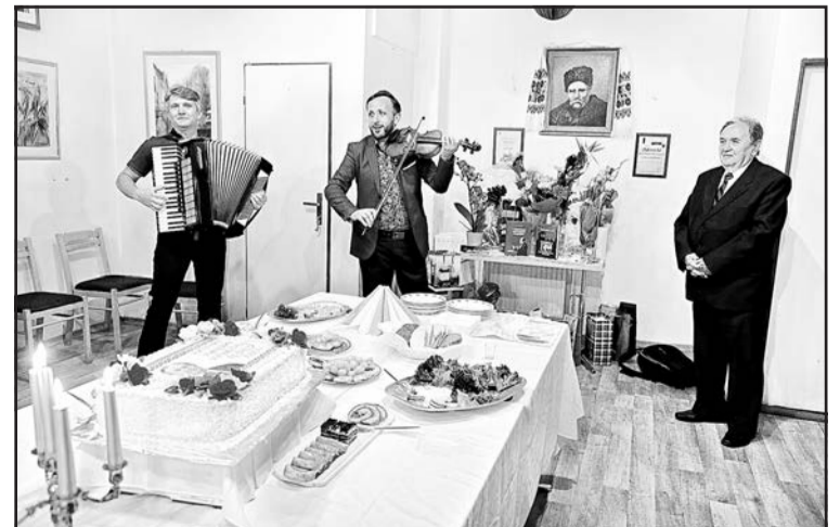
▲ Ювіляра прийшов привітати і відомий музикант Андрій Кандрач.