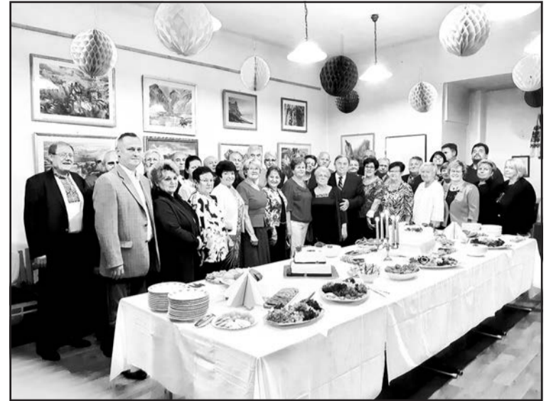
▲ Учасники «Зустрічі з ювіляром».