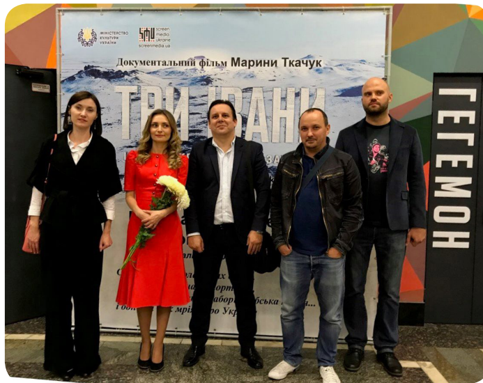
Творча група під час презентації

( За публікаціями журналу «Українська культура» № 4-6/2020 р. та газети «День» № 243-244, 23-24 грудня 2020 р.)