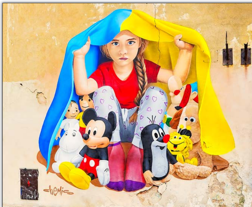
У Празі з'явився мурал із дівчинкою, яка під українським прапором ховає відомих казкових героїв.