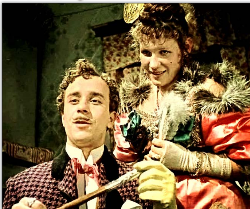
Легендарному українському фільму «За двома зайцями» – вже понад 60. У грудні 1961-го відбулася прем'єра української кінокомедії, що через певний час стане улюбленою, народною, усіма цитованою, навіть культовою. Режисером екранізації п'єси Михайла Старицького був Віктор Іванов.