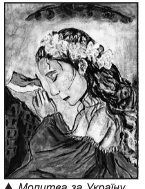
▲ Молитва за Україну.

них місяців СНМ – МУК тісно співпрацював з організацією «Людина в біді» ( Človek v ohrozeni ), місія котрої – допомагати людям, які з різних причин втратили свою безпеку, гідність чи свободу. Представлена виставка сформувалась з ініціативи цієї організації. Забезпечення такої виставки виходить за рамки життєво необхідної матеріальної допомоги, котру зазвичай надає ця організація, набирає ознаки глибшого, духовнішого ставлення до біженців, до їх естетичного бачення, допомагає їх психологічній реабілітації засобами мистецтва, культури загалом. І дорослим, і діточкам дали простір виплеснути свої емоції, почуття посередництвом кольорів на папір і в результаті виникли чудові аматорські роботи, котрі СНМ – Музей української культури має честь представляти у своїх приміщеннях.