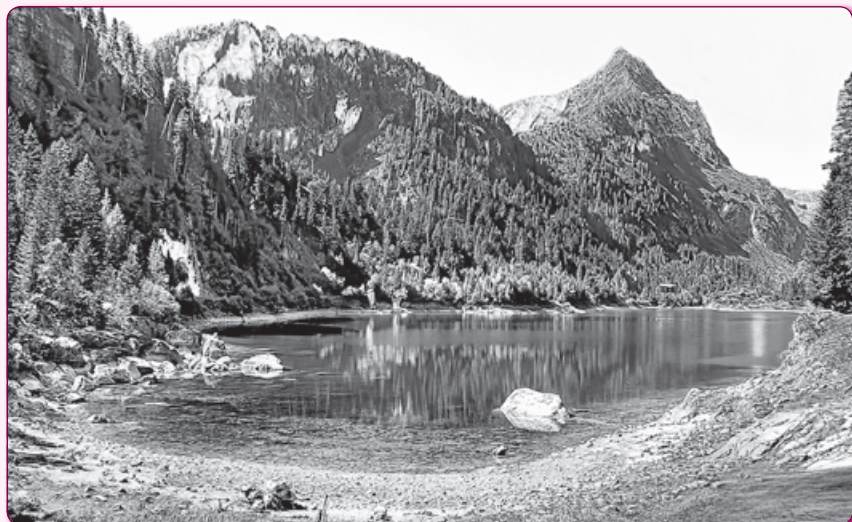
Синевир – найбільше гірське озеро України.

У грайливому озерці Плавають хмаринки, Там верхи свої купають Буки і ялинки. І дзвіночки прибережні Дивляться у нього, Навіть місяць не минає Озера гірського. Глянь на тихі, лазурові, Кристалеві води. Це озерце у Карпатах - Дзеркало природи.