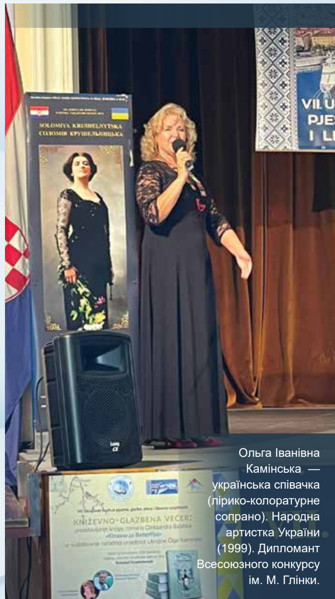
Ольга Іванівна Камінська — українська співачка (лірико-колоратурне сопрано). Народна артистка України (1999). Дипломант Всесоюзного конкурсу ім. М. Глінки.

У Республіці Хорватії в 7 жупаніях і в Загребі із загальної кількості 1202 виборців проголосувало 174 виборці або 14,47 %, які обрали 7-х Представників української національної меншини на рівні жупанії (повіту), 1 Представника української національної меншини в Загребі та 1 Представника української національної меншини на рівні міста у місті Вуковар та дві Ради українських національних меншин на муніципальному рівні, у муніципалітетах Богданівці (село Петрівці) та Липовляни. / Славко Бурда