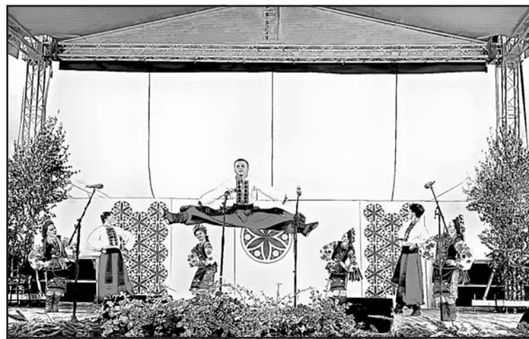
▲ Юні танцюристи з Ужгорода затанцювали в Підгороді і славнозвісного гопака.