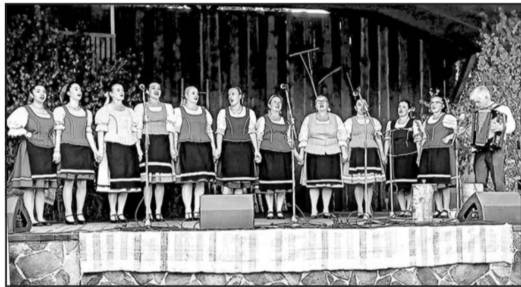
▲ На сцені співацька група Ублянка з Ублі.