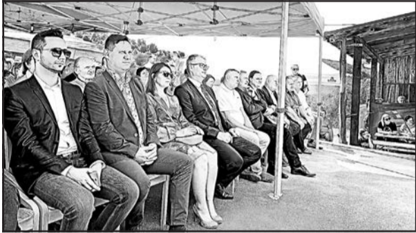
▲ Погляд на гостей.

1-ого вересня в православному храмі св. пророка Іллі та св. Максима Сандовича у вечірній час пройшли Акафіст до св. Максима Сандовича та Велика вечерня.