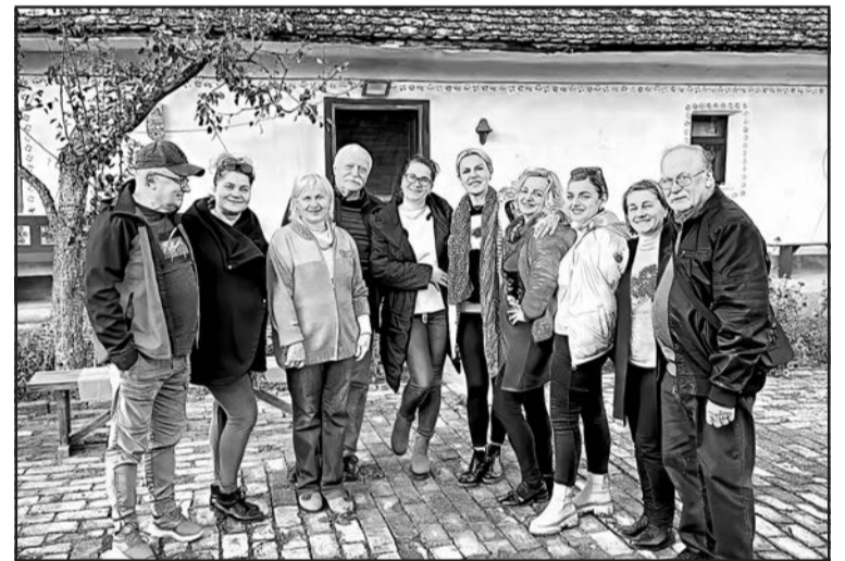
▲ В гостях у етнобудинку «Опорія»..

Стемфорд, США – В суботу, 28 жовтня 2023 р., Організація Оборони Лемківщини в Америці (ООЛ) відбула 32-й Крайовий з'їзд в приміщеннях Семінарії св. Василя та Стемфордської Української Католицької Єпархії. Захід продовжує 90 років діяльності ООЛ, чие коріння сягає вересня 1933 року, коли група лемків зібралася в Нью-Йорку, щоб створити комітет для надання матеріальної допомоги своїй батьківщині. Цей комітет перетворився на ООЛ, який з того часу проводив гуманітарну, культурну та освітню роботу для підтримки корінних мешканців Лемківщини (розташованої на території сучасної південно-східної Польщі) та їхніх нащадків по всьому світу.