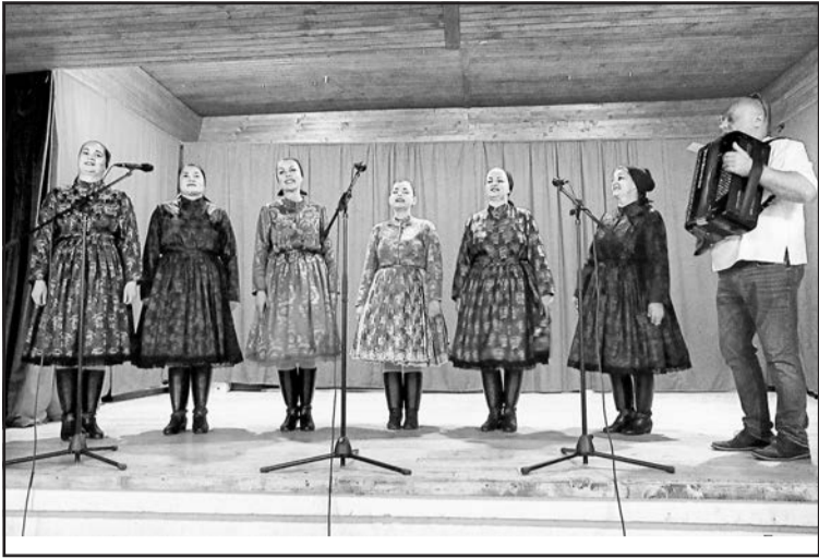
▲ «Стужиця» в Дюрдьові.

Початком листопада жіноча співацька група «Стужиця» виступила перед публікою одразу в двох місцях сербської Воєводини. Насамперед, в суботу ввечері, 4 листопада, в приміщенні Будинку культури ім. Тараса Шевченка в селі Дюрдьов, де проживає великий анклав русинів, в програмі «Шайкашські дні толерантності», організованій жіночою спілкою «Опорія» з Дюрдьова. Оскільки аудиторія була заповнена ними, мовного бар'єру не було. Разом з ними на дюрдьовській сцені також виступили молоді декламатори, які читали вір-