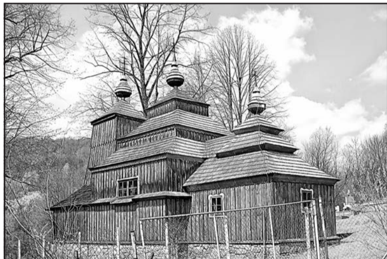
▲ Прикря. Національна пам'ятка культури – храм св. Архангела Михаїла (1777).

Як же було в Прикряі у минулому? Мадярські статистики свідчать, що у 1880 році в Прикряі проживало 106 осіб, з них 105 були руснаками, 1 особа не вміла говорити (ймовірно, мова йшла про немовля). Із 106 жителів 99 осіб було греко-католиками, 7 осіб належало до єврейської общини. У 1890