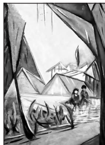
▲ Йосиф Мулик «Рибалки». Акрил на картоні.