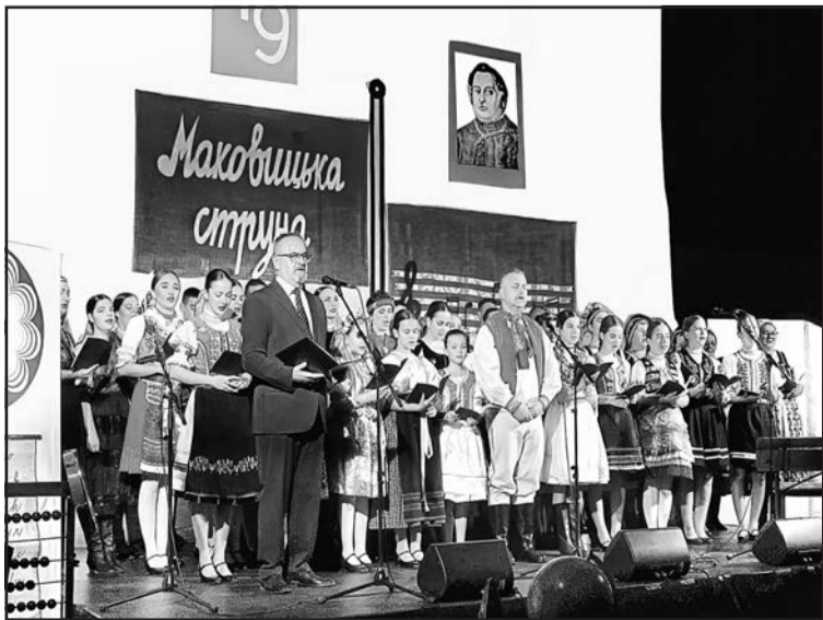
▲ Сцена з концерту.