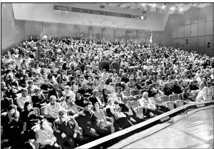
▲ Переповнений зал в Пряшеві – потіха для співаків і організаторів.