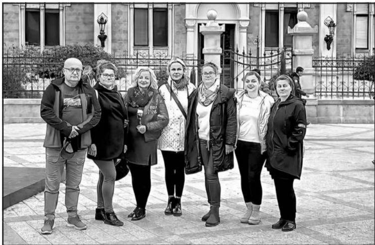
▲ «Стужиця» перед архієпископською резиденцією Православної церкви в Новому Саді.

Звичайно, окрім виступів, члени групи також відвідали в суботу вранці одне з найкрасивіших міст на Дунаї, Новий Сад, а також побували у фортеці Петроварадин, яка височіє над Дунаєм. У другій половині дня вони відвідали етнобудинок «Опорія» в Дюрдьові, це