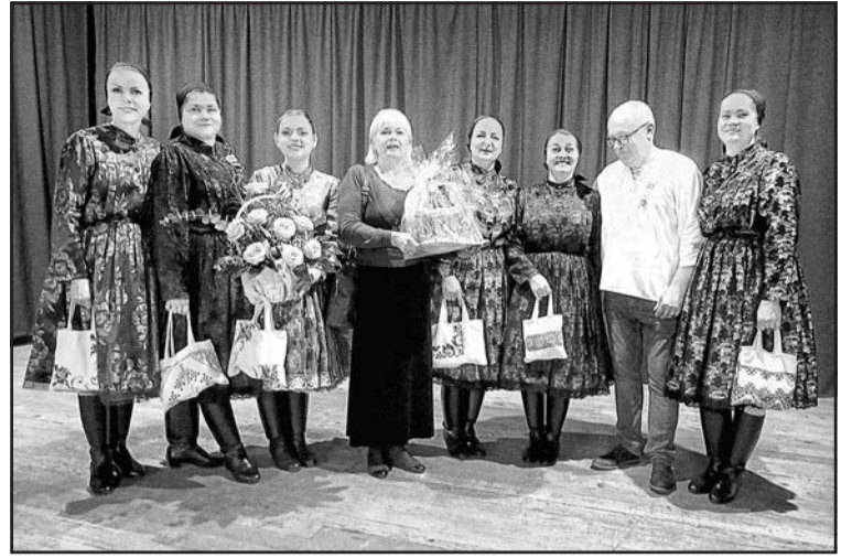
▲ Після одержання пам'ятних подарунків.

Після цього відбувся незапланований третій блок програми, під час якого співали улюблені пісні воєводинських русинів, здебільшого не співаки, а глядачі в залі, оскільки «Стужиця» тільки-но почала співати, а вони вже вросли в пісню. Після програми відбулася товариська зустріч, під час якої учасники не тільки співали, але й танцювали. Було також запрошення виступити в їхніх