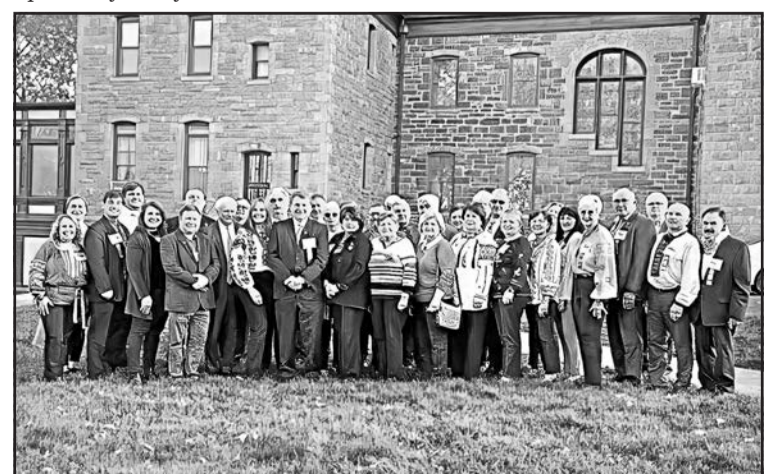
▲ Делегати 32-го Крайового З'їзду ООЛ.