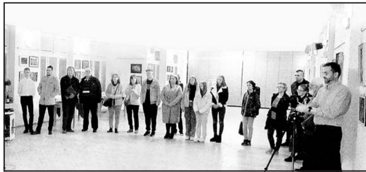
▲ Під час відкриття виставки.