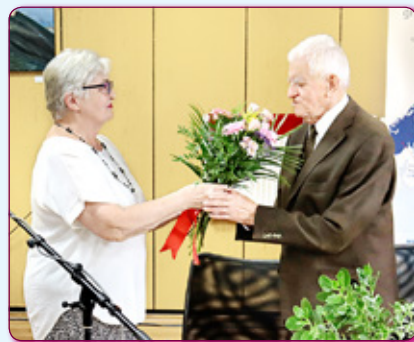
Квіти для ювіляра.

Складовою цієї імпрези була і презентація його нової збірки оповідань – «Оповідання з правої долоні».