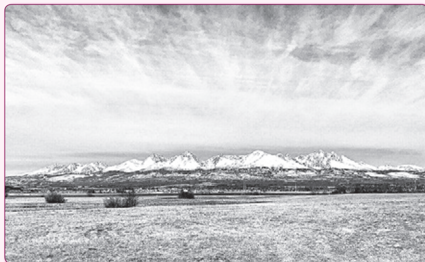
Шпи́лі Високих Та́тр прикрив перший сніг. Зима вже близько.