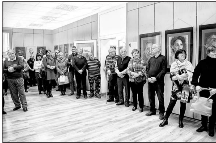
▲ Частина глядачів виставки.

Саме тому її роботи унікальні, різноманітні і неповторні. Якщо запитати художницю, чому вона