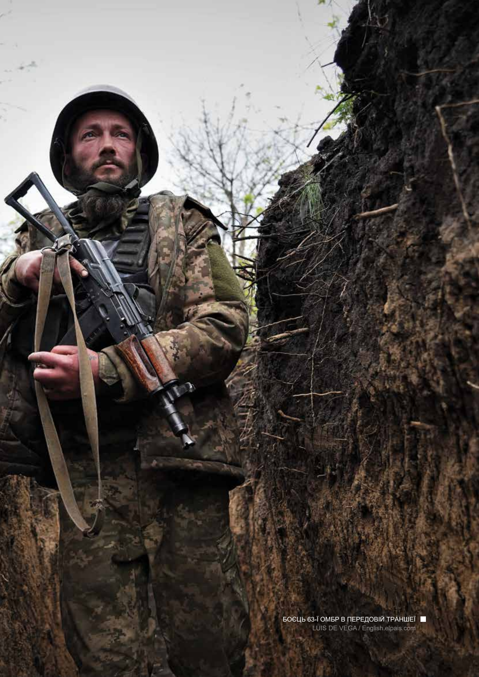
БОЄЦЬ 63-Ї ОМБР В ПЕРЕДОВІЙ ТРАНШЕЇ