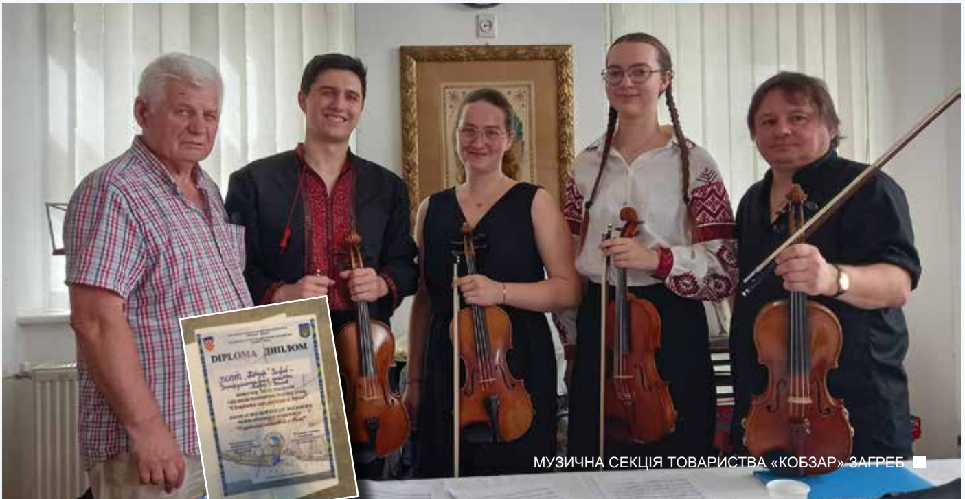
МУЗИЧНА СЕКЦІЯ ТОВАРИСТВА «КОБЗАР» ЗАГРЕБ

Європейського конгресу українців. Цими днями відбулася розмова з усіма колишніми президентами і було домовлено, що в серпні цього року Форум ЕКУ відбудеться в Тернополі, Україна, а 75-річчя ЕКУ буде офіційно та урочисто відзначено в Брюсселі під час щорічної зустрічі постійних та асоціативних членів ЕКУ.