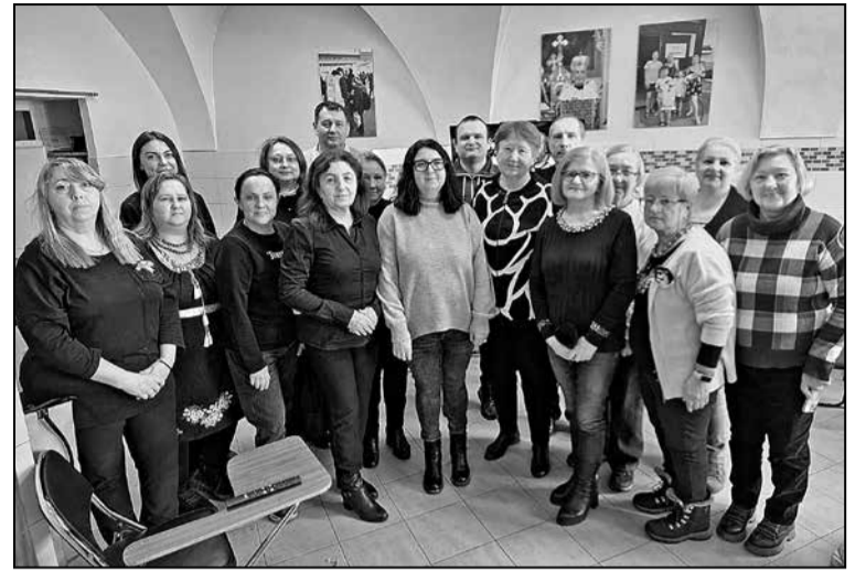
Загальна світлина учасників пам'ятної зустрічі 25.2.2025