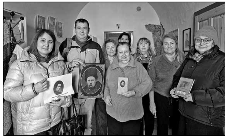
Учасники вечора з нагоди 211-ої річниці від дня народження Т. Шевченка.