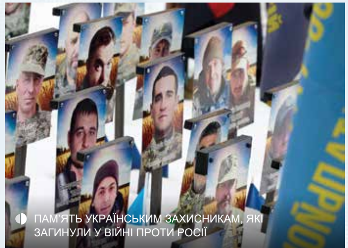
ПАМ'ЯТЬ УКРАЇНСЬКИМ ЗАХИСНИКАМ, ЯКІ ЗАГИНУЛИ У ВІЙНІ ПРОТИ РОСІЇ

Точні дані про військові втрати встановити складно. За оцінками Центру стратегічних і міжнародних досліджень (CSIS), загальна кількість загиблих, поранених і зниклих безвісти з обох сторін наближається до 1,8 мільйона. Йдеться приблизно про 1,2 мільйона російських військовослужбовців і близько 600 тисяч українських. Кількість загиблих оцінюється у близько 140 тисяч українських і до 325 тисяч російських солдатів.