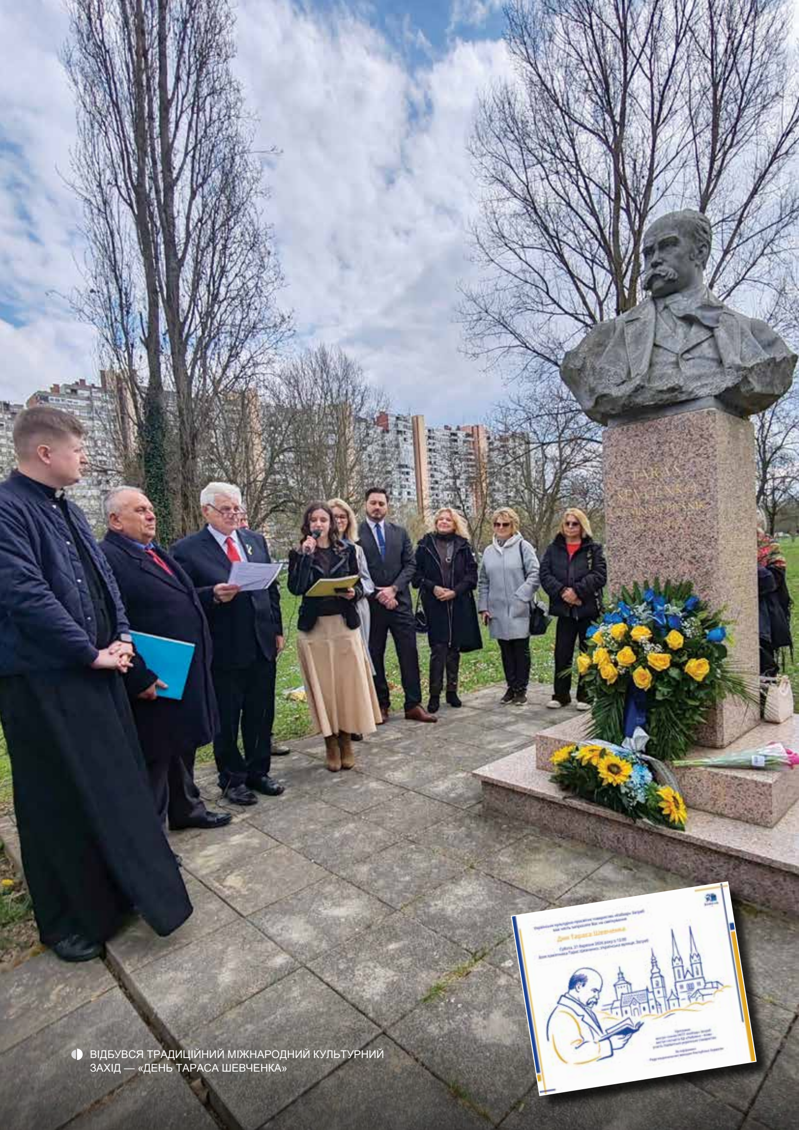
● ВІДБУВСЯ ТРАДИЦІЙНИЙ МІЖНАРОДНИЙ КУЛЬТУРНИЙ ЗАХІД — «ДЕНЬ ТАРАСА ШЕВЧЕНКА»