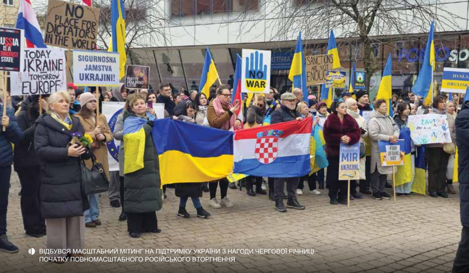
ВІДЕБУВСЯ МАСШТАБНИЙ МІТИНГ НА ПІДТРИМКУ УКРАЇНИ З НАГОДИ ЧЕРГОВОЇ РІЧНИЦІ ПОЧАТКУ ПОВНОМАСШТАБНОГО РОСІЙСЬКОГО ВТОРГНЕННЯ