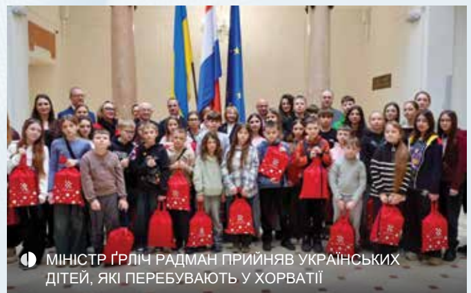
МІНІСТР ГРЛІЧ РАДМАН ПРИЙНЯВ УКРАЇНСЬКИХ ДІТЕЙ, ЯКІ ПЕРЕБУВАЮТЬ У ХОРВАТІЇ

За даними української сторони, з початку повномасштабного вторгнення близько 20 тисяч українських дітей були насильно вивезені на територію Росії або на