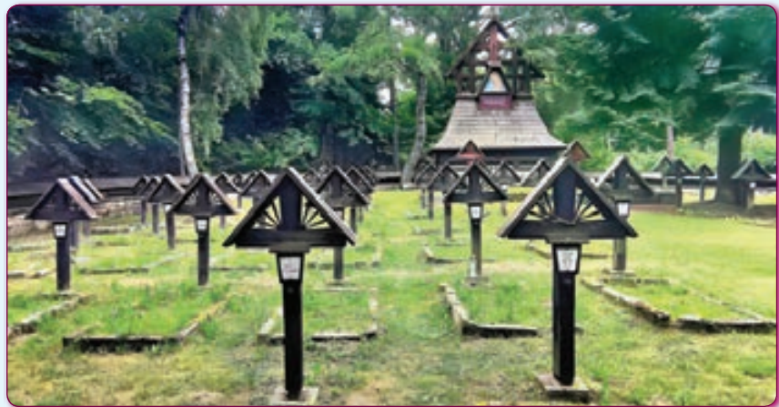
Один з військових цвинтарів полеглих у першій світовій війні.